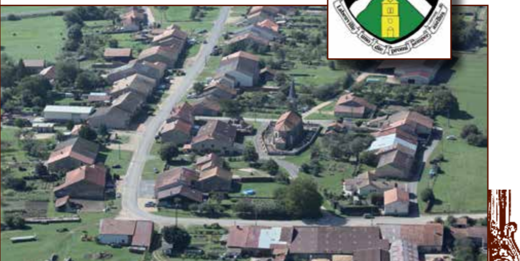
Unes de Labeuville et le blason du village "Babeuville 1 jour, plat cul toujours"

vitrail de Jeanne d'Arc conduisant les soldats français. Il donne la direction de Metz.