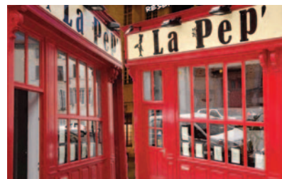
Restaurant du mercredi soir

36 avenue de la Chartreuse 54510 ART SUR MEURTHE Tél. +33 3 83 56 97 76