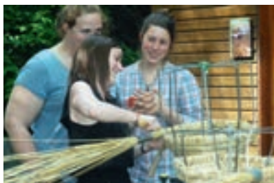
Des étudiantes des BTS Production animale et Sciences et techniques des aliments lors d'une formation au Luxembourg : Les abeilles à l'école. Projet TT de l'EPLEFPA Nancy-Pixerécourt.