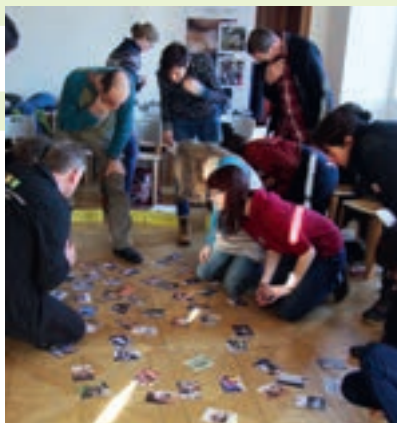
Des apprenants du CS Tourisme vert, accueil et animation en milieu rural aux rencontres EDD de la Grande Région. Projet TT de l'EPLEFPA Nancy-Pixerécourt.