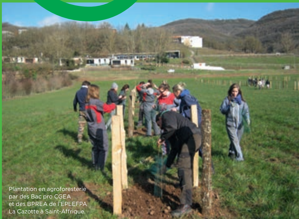
Plantation en agroforesterie par des Bac pro CGEA et des BPREA de l'EPLEFPA La Cazotte à Saint-Affrique.

Les 27, 28, 29 et 30 novembre 2017 CEZ-Bergerie nationale de Rambouillet